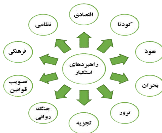
الگوی مفهومی (۱): راهبردهای استکبار