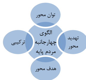
شکل ۳. الگوی چهارجانبه مردم‌پایه ( فرتوک‌زاده، ۱۳۹۵: ۸۱)

در الگوهای مناسب برای تدوین راهبرد دفاعی مردم‌پایه، چهار الگوی هدف‌محور، تهدید‌محور، توان‌محور و الگوی ترکیبی وجود دارد که با تکیه بر ایدئولوژی استقلال و توانمندی‌های ملی، اتکا به بسیج مردمی - به مثابه عمق راهبردی نظام - و با بهره‌گیری از راهبرد موفق انسجام مردمی در شکل‌گیری توان دفاعی الگوی مردم‌پایه در صدد ارائه الگوی راهبرد دفاع مردمی با رویکرد بازدارندگی است (باقری، ۱۳۹۲: ۵۲)؛ از این‌رو برای شناخت بیشتر چهار الگو، در ذیل به شرح هر کدام از الگوهای چهارگانه اشاره می‌شود: