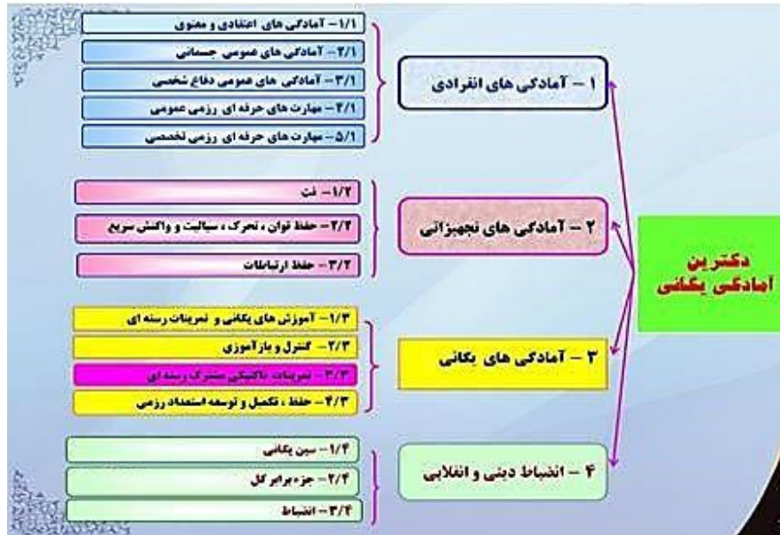
شکل ۱. دکترین آمادگی یگانی، (۱۳۸۵)