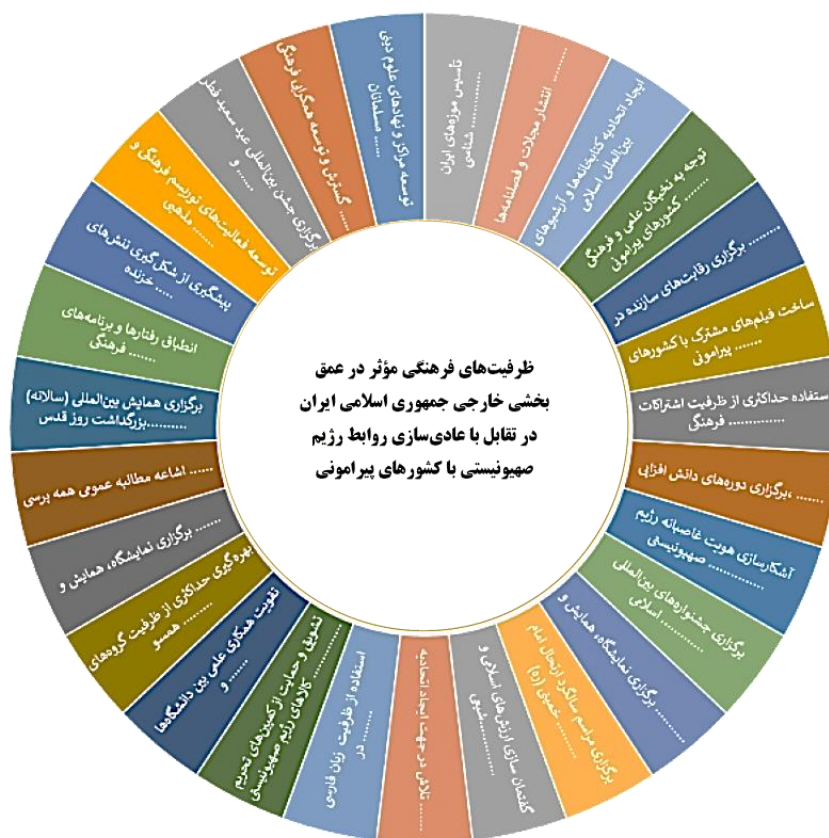
شکل ۲؛ مدل مفهومی تحقیق