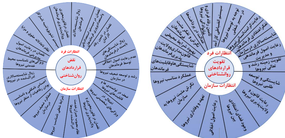
شکل ۳. مدل مفهومی (نویسندگان، ۱۴۰۳)

سیستم‌های نظامی اعم از ارتش، سپاه، فراجا و وزارت دفاع با پرسش‌نامه محقق ساخته شامل ۳۹ گویه انجام شد.